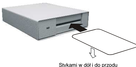
rys1. przód konwertera RCP58WC

W określonych przypadkach w celu odczytu kodu identyfikatora należy wsunąć identyfikator (chipem z przodu i do dołu) do konwertera w otwór znajdujący się z przodu konwertera (podłużna szczelina obok kontrolki).